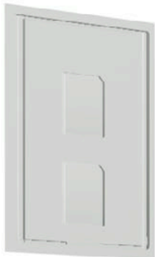
Blister 2 SD-Karten