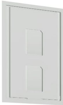
Blister 2 SD-Karten

Neben einer konsequent hohen Displaywirkung bieten wir Ihnen mit unserem Verpackungsservice die flexible und maßgeschneiderte Lösung – der geringe Materialverbrauch garantiert günstige Preise und ein geringes Verpackungsvolumen bei optimaler Präsentation Ihrer Produkte. Für mehr Erfolg im Verkauf liefern wir das passende Werkzeug und realisieren auf Wunsch auch individuelle Blisterhauben. Zur Sicherung Ihrer Produkte und deren optischer Wirkung verwenden wir ausschließlich hochwertiges, beschichtetes Trägermaterial für die Verpackung.